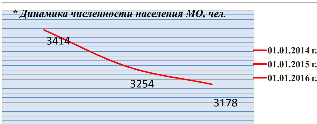
Рис. 1. Динамика численности населения МО и численность населения муниципального образования «Галкинское сельское поселение» по состоянию на 01.01.2016 г.